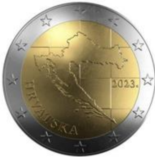
Geografska karta Hrvatske